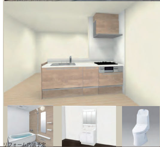
リフォーム内装予定