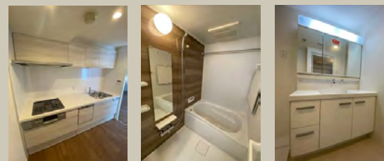
Kitchen Bathroom Powderroom