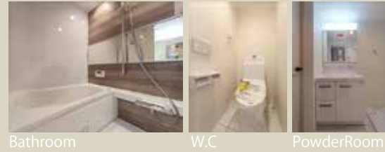
Bathroom W.C PowderRoom