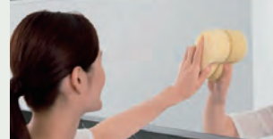
お掃除ラクラク鏡 表面を炭素の膜で覆ったお掃除ラクラク鏡 なら、簡単なお手入れで水あかを楽に落と せます。