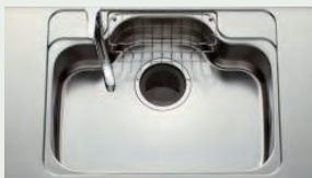
ステンレスシンク 水はね音が抑えられるため、 会話を妨げられることはありません。