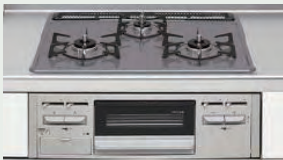
ホーロートップコンロ（60cm）