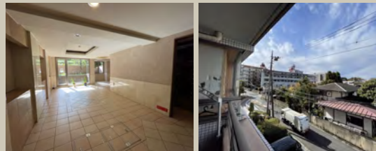
マンション共有部