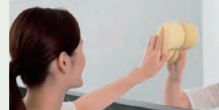
お掃除ラクラク鏡 表面を炭素の膜で覆ったお掃除ラクラク鏡 なら、簡単なお手入れで水あかを楽に落と せます。