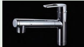
浄水器内蔵型水栓