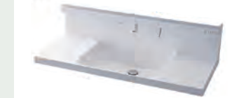
キレイアップカウンター バックガードがミラー下まであり洗面ボウルと 一体成形になったキレイアップカウンター。 つなぎ目などの凹凸がなく、飛び散った水滴を サッと拭き取れます。