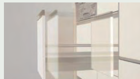
サイレントレール やさしく静かに閉まる ダンパー機能を搭載