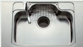
ステンレスシンク 水はね音が抑えられるため、 会話を妨げられることはありません。