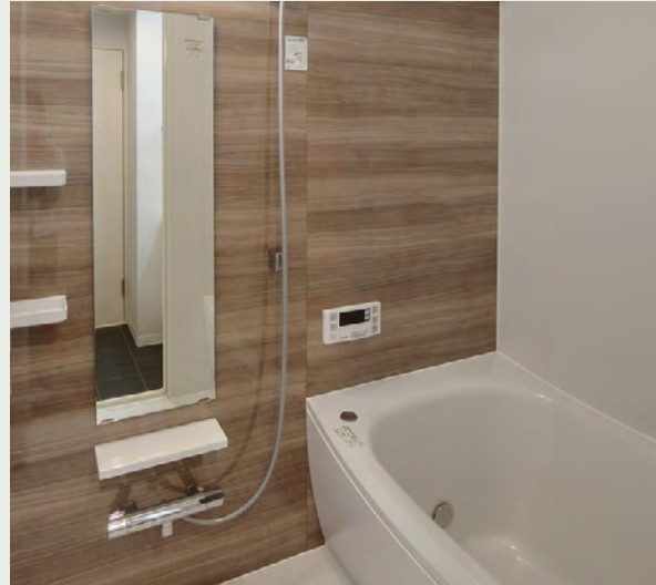
アクセントパネル：ノルディーグレーウッド

機能的なアイテムで、いつでも快適なお風呂空間へ。 スマートカウンターが浴室空間を引き立てます。