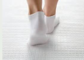
カラリ床 翌朝にはカラッとさわやか。 水が引いて翌朝カラリ。