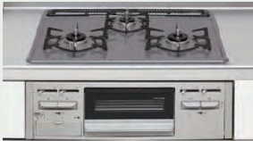
ホーロートップコンロ (60cm)