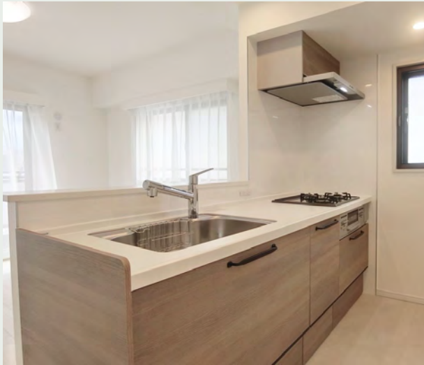
扉カラー：エルムモカ