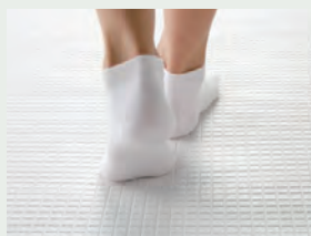
カラリ床 翌朝にはカラッとさわやか。 水が引いて翌朝カラリ。