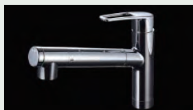
浄水器内蔵型水栓