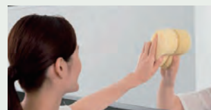
お掃除ラクラク鏡 表面を炭素の膜で覆ったお掃除ラクラク鏡 なら、簡単なお手入れで水あかを楽に落と せます。