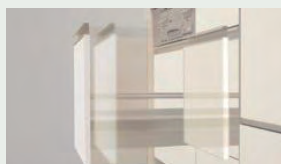
サイレントレール やさしく静かに閉まる ダンパー機能を搭載