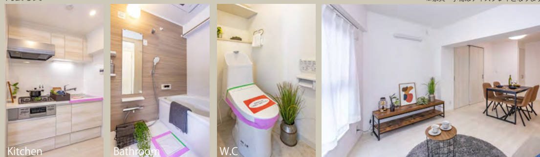
おすすめポイント