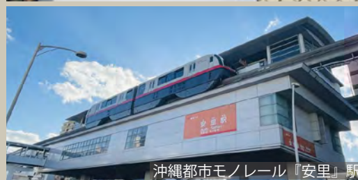
沖縄都市モノレール「安里」駅