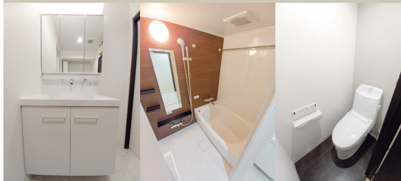
Powder Room Bathroom