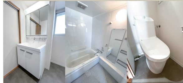
Powder Room Bathroom WC