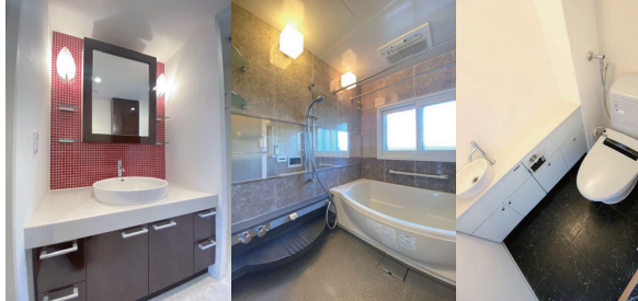
Powder Room Bathroom