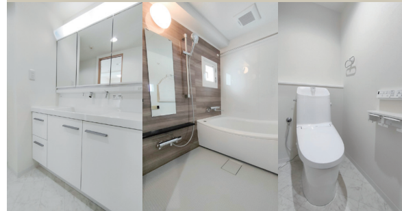
Powder Room Bathroom