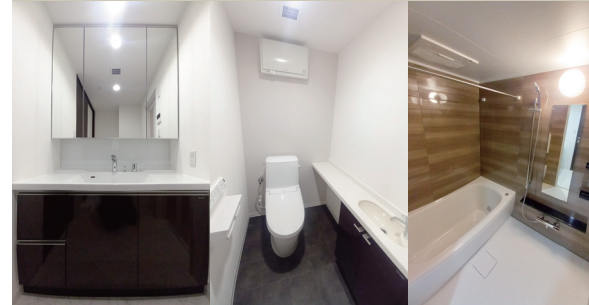
Powder Room WC