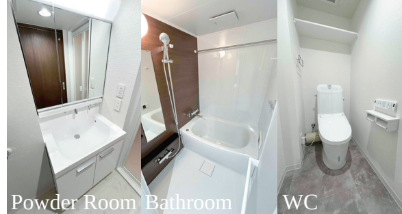
Powder Room Bathroom