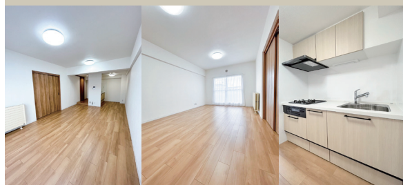
Living Living Kitchen