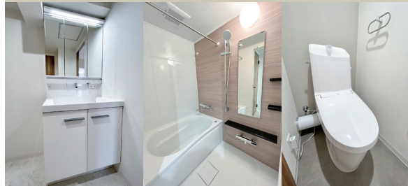
Powder Room Bathroom WC