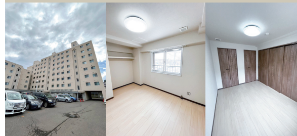
Exterior Bedroom Bedroom