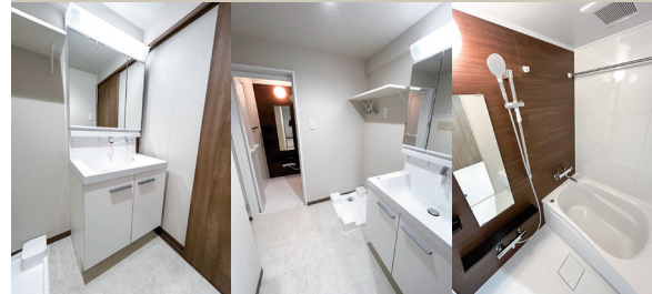
Powder Room Powder Room Bathroom