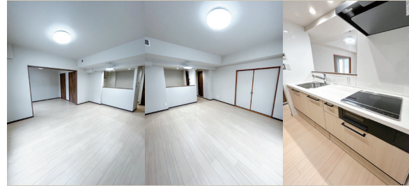
Living Living Kitchen