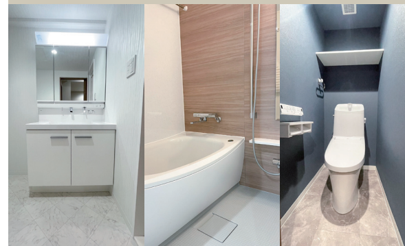
Powder Room Bathroom WC