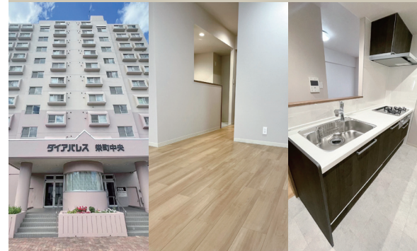
Exterior Living Kitchen