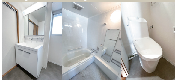
Powder Room Bathroom WC