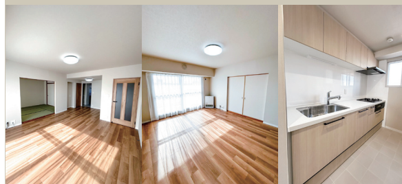
Living Living Kitchen