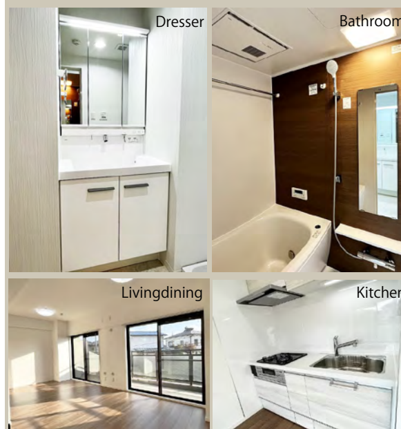
おすすめポイント