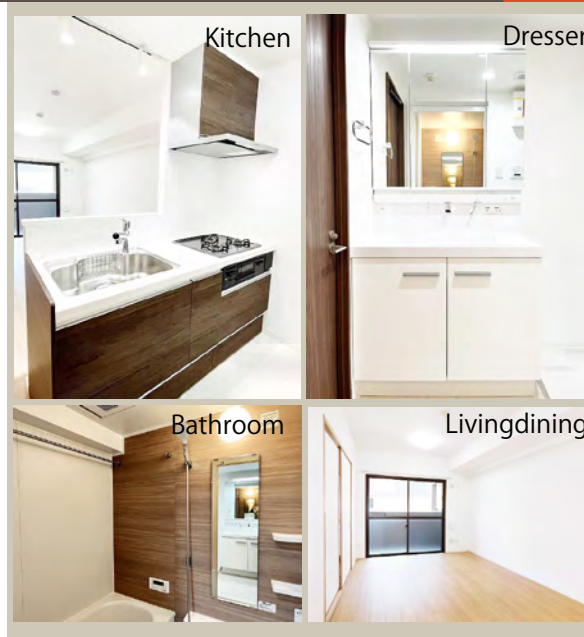
おすすめポイント